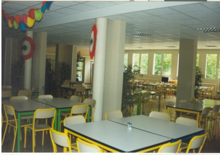
Grande Salle dans chaque bâtiment.